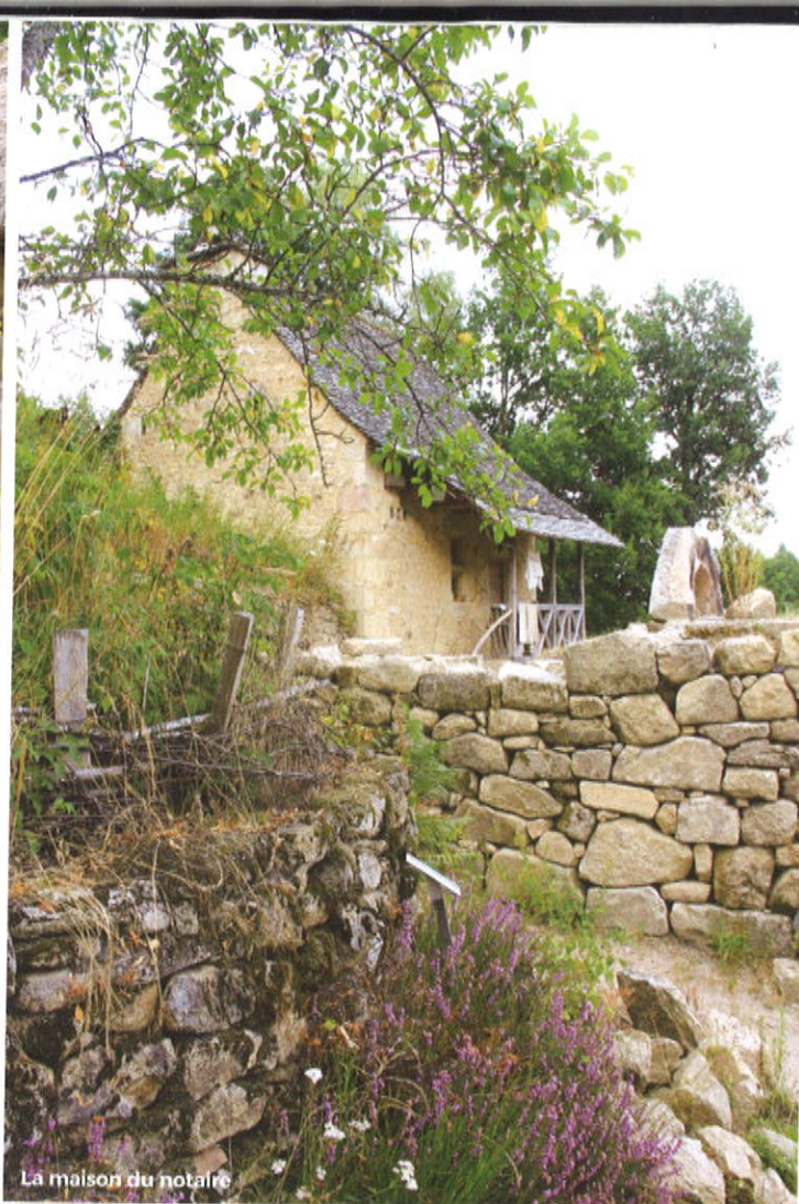
La maison du notaire