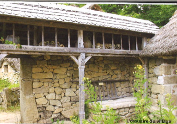
L'ossuaire du village