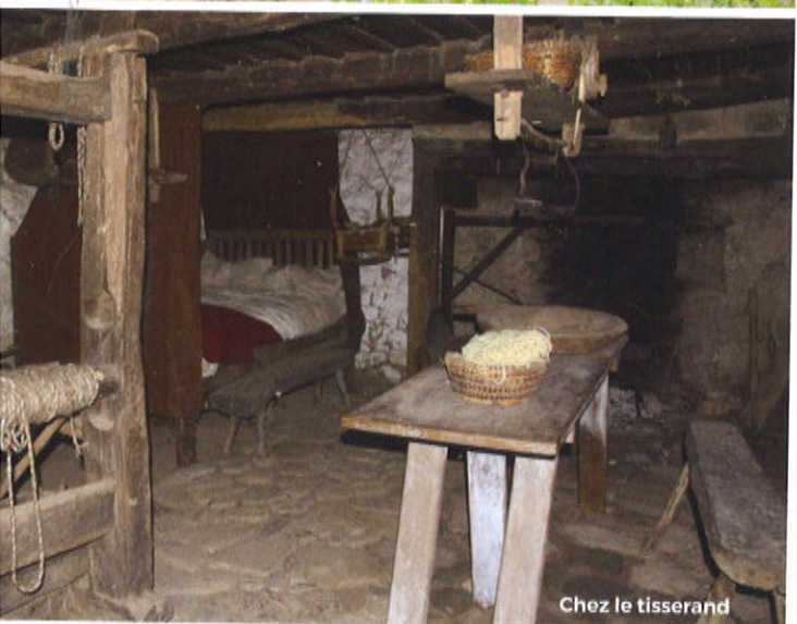
Chez le tisserand