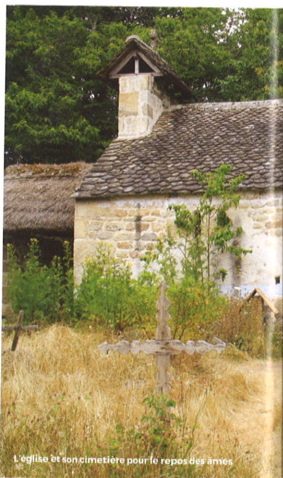
L'église et son cimetière pour le repos des âmes

De la basse-cour aux paires, les animaux